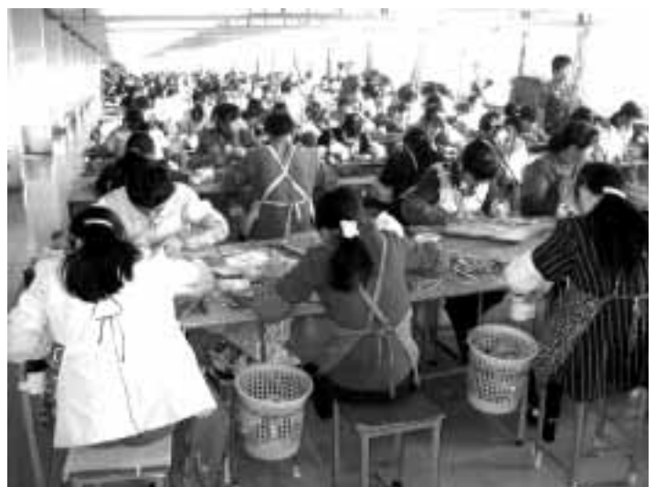
Hunderte Arbeiterinnen in einem Saal.