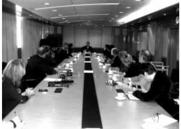
Interessante Hintergrundgespräche mit Politik, Wirtschaft, Sicherheit und Medien in Hong Kong.

Der Hong Kong Dollar ist übrigens nach wie vor eine eigenständige und international anerkannte Währung, die an den US Dollar gekoppelt ist.