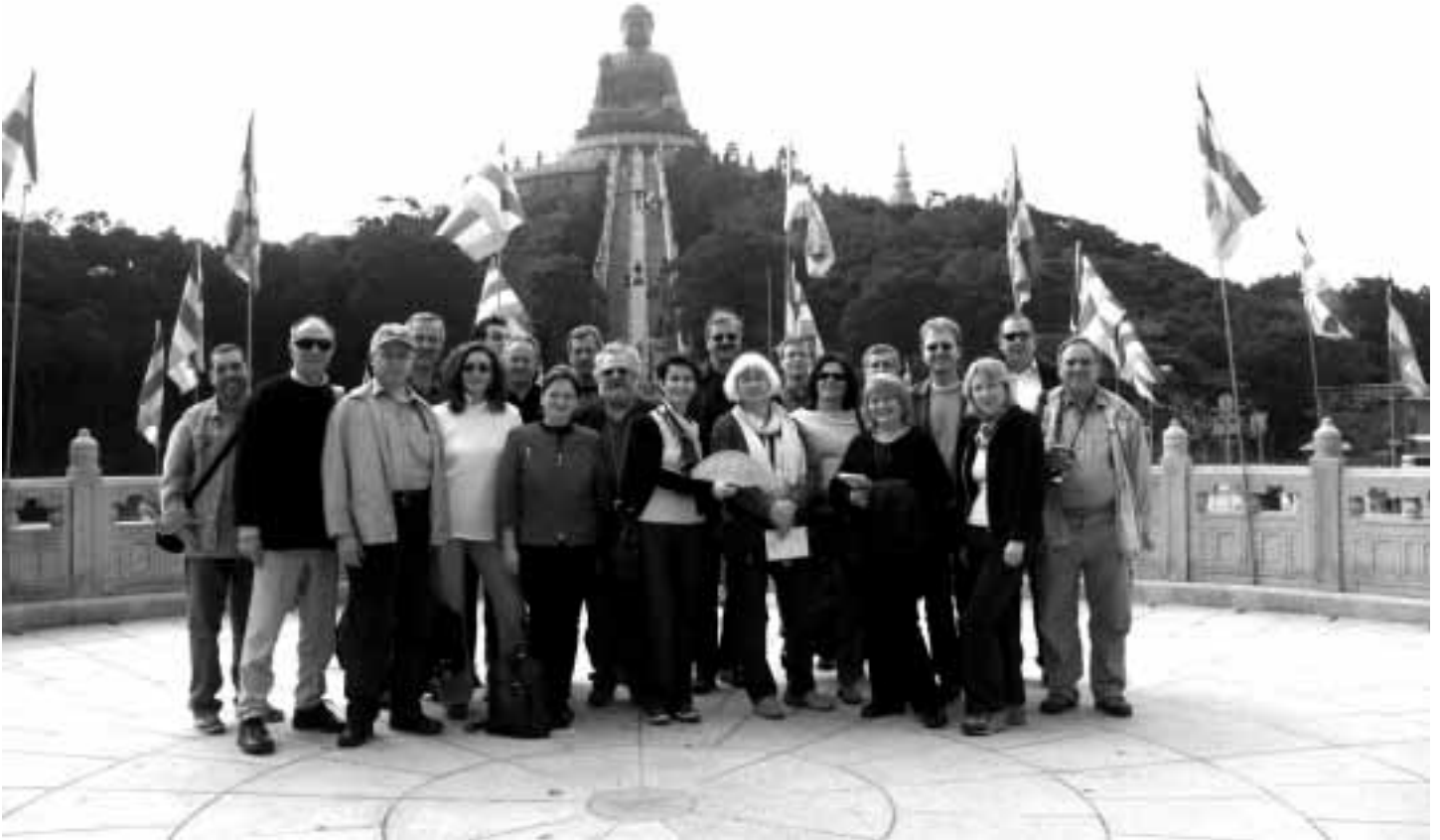
Die ÖJC-Gruppe während der Studienreise „Hong Kong und Shenzen“ 2003.

Die Reise von 22 ÖJC-Mitgliedern nach Hong Kong (man schreibt die frühere britische Kolonie dort wirklich so) und Shenzen war eine widersprüchlichsten und damit interessantesten Studienreisen, die der Österreichische Journalisten Club je durchgeführt hat.