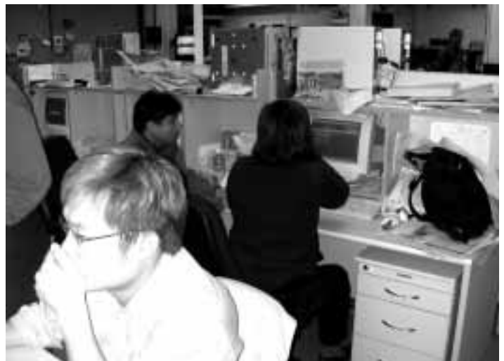
Redaktionsraum einer Radiostation in Hong Kong.